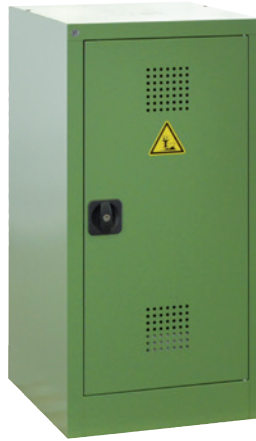
PSM 500-1000 P, Artikel-Nr. B80-6554-A