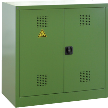
PSM 1000-1000 P, Artikel-Nr. B80-6556-A