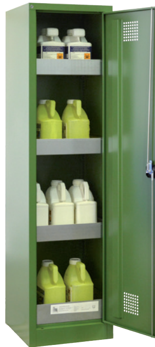
PSM 500 P, Artikel-Nr. B80-6555-A