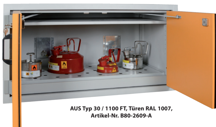
AUS Typ 30 / 1100 FT, Türen RAL 1007, Artikel-Nr. B80-2609-A