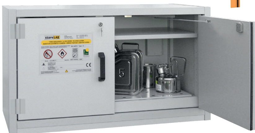
AUS Typ 30 / 1100 FT, Türen RAL 7035, Artikel-Nr. B80-2602-A