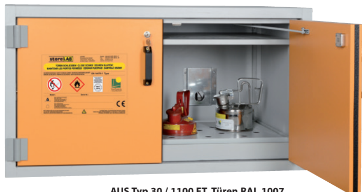
AUS Typ 30 / 1100 FT, Türen RAL 1007, Artikel-Nr. B80-2609-A